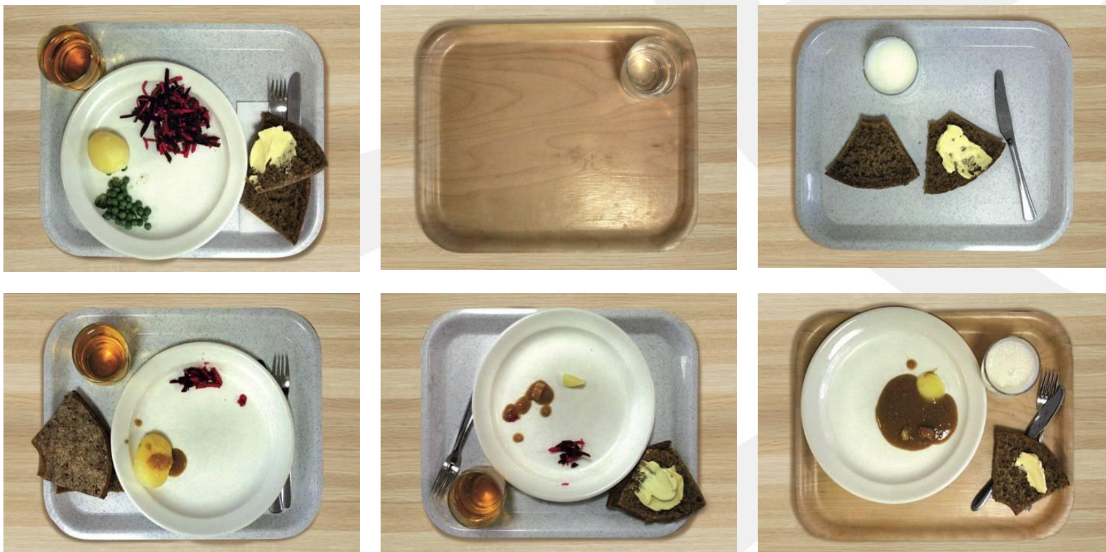
Kuvat on otettu 7. luokkalaisten tarjottimista ruoanoton jälkeen.

Ole kiinnostunut lapsesi kouluruokailusta ja huolehdi, että myös kuntapäätäjät ovat.